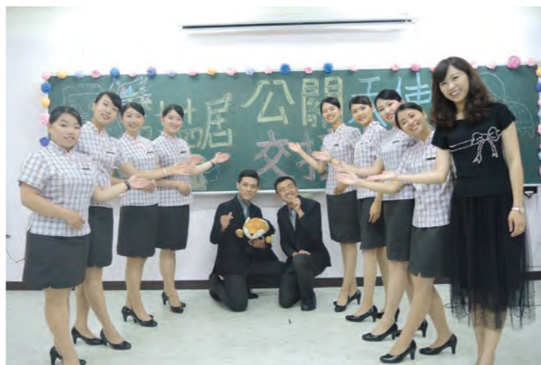
2018.6.12 第 13、14 屆公關天使交接典禮。

在這個社團裡很多人都是想當空姐，而我自己則是想從事金融業，其實金融業也相當重視儀態，想藉由這個社團加強這個部分。入團後，發現壓力真的很大，因為團員間必須一起面對很多的會議、活動以及學長姐們的教導，但是學到更多的是團隊合作、接待過程中靈機應變的能力，以及