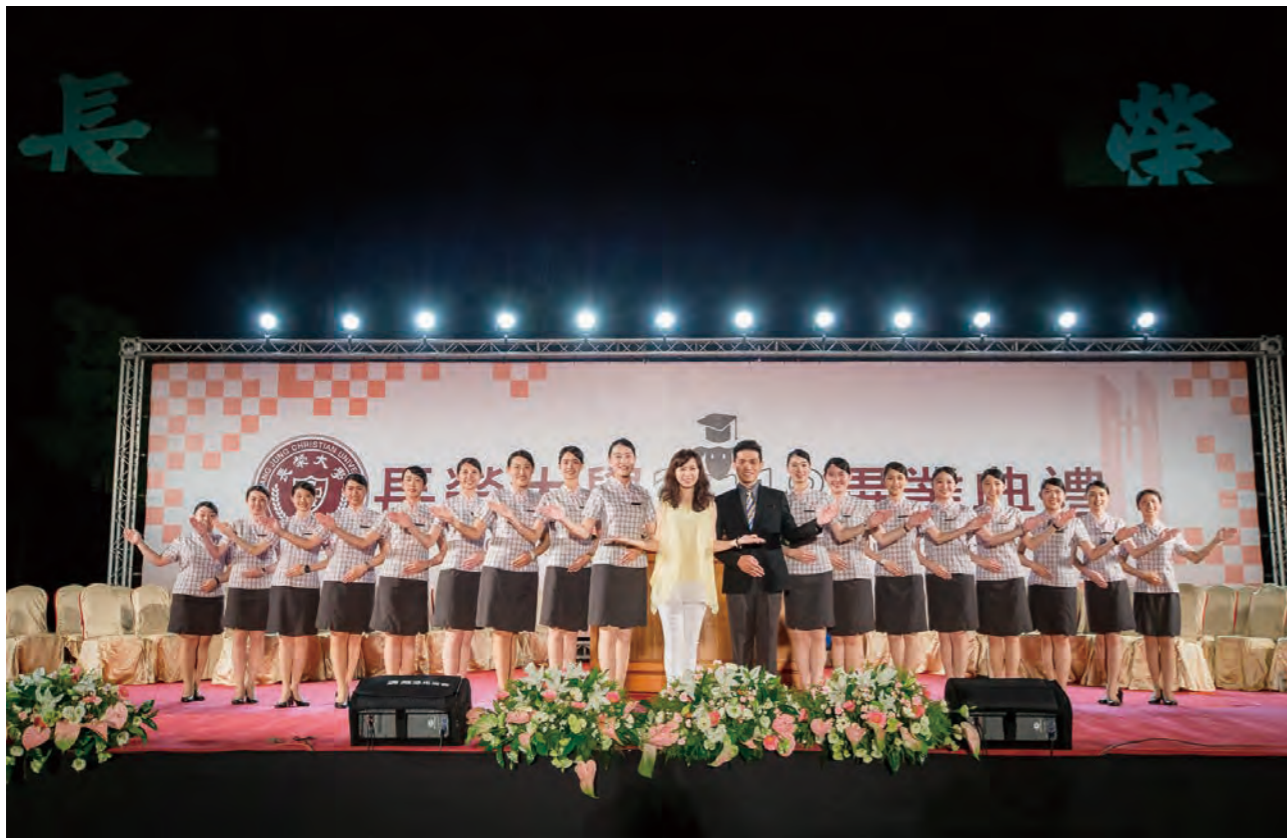
2018.6.9 長榮大學 2018 畢業典禮。