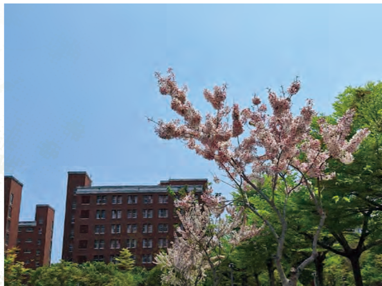
第二教學大樓前停車場的花旗木

陽春時節，桃風拂面，燕語鶯啼；此時，校園已一改冬季慣有陰鬱蕭索的冷寂氛圍。漫步其內，但見青翠欲滴的嫩芽爭先恐後的自原是枯褐的枝枒間冒出，一片片燦爛若繁星的花海怒放其上。天朗氣清，蒼穹的湛藍、雲朵的無暇潔白、各建築物古樸的朱紅色外磚牆，佐襯草木的鮮綠與花簇的萬紫千紅，整座校園美得如同一幅繪畫大師的曠世傑作。