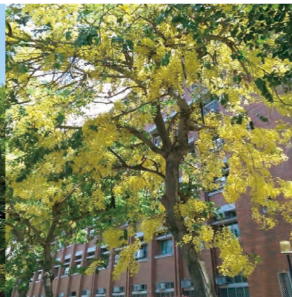
第二教學大樓旁的阿勃勒