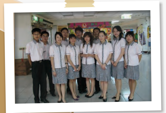
第一代制服 (第1、2屆團員所使用)