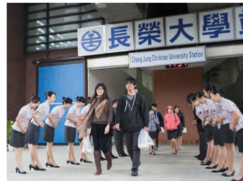
公關天使辦早安你好活動。

每週進行一次團會，並且在團會裡安排一些基礎練習，例如笑容、走站姿、頒獎、遞麥克風……等等的課程，也會在假日安排進階課程訓練，邀請外師為我們進行授課，針對接待或是能提升團員素質的相關課程來做安排。