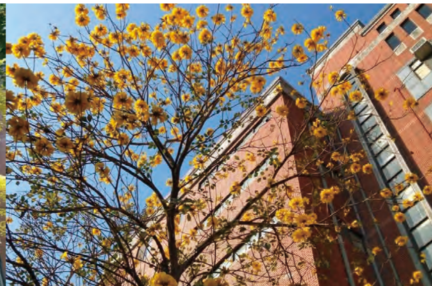
第一宿舍前的黃花風鈴木