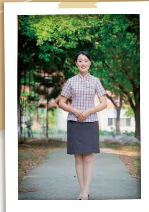
第二代制服 (自第3屆團員使用2018年)