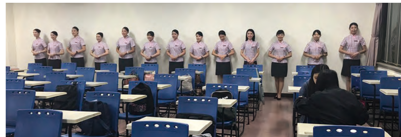
美姿美儀站姿練習。