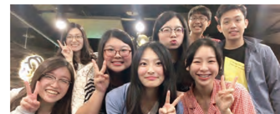
與值班經理們合影

看到值班經理們的能力逐漸進步、成長，學會新的知識和技能，並且能夠在時間內完成任務，能